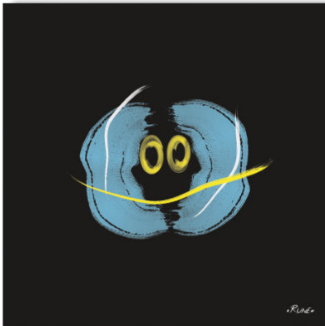
Vuk - L'hypersensible . Vuk - The hypersensitive