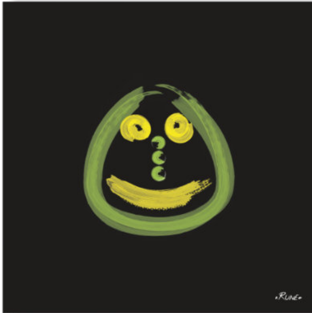
Thrulun - Le paresseux . Thrulun - The lazy 100x100cm