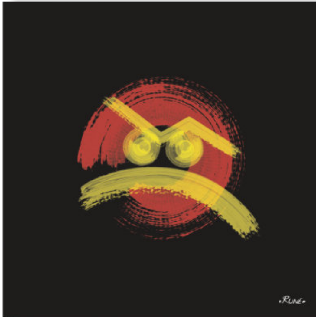
Steakea - Le colérique . Steakea - The choleric