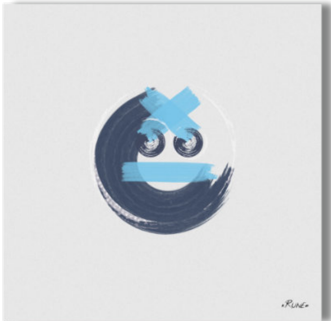
Lorken - Le surhomme . Lorken - The superman