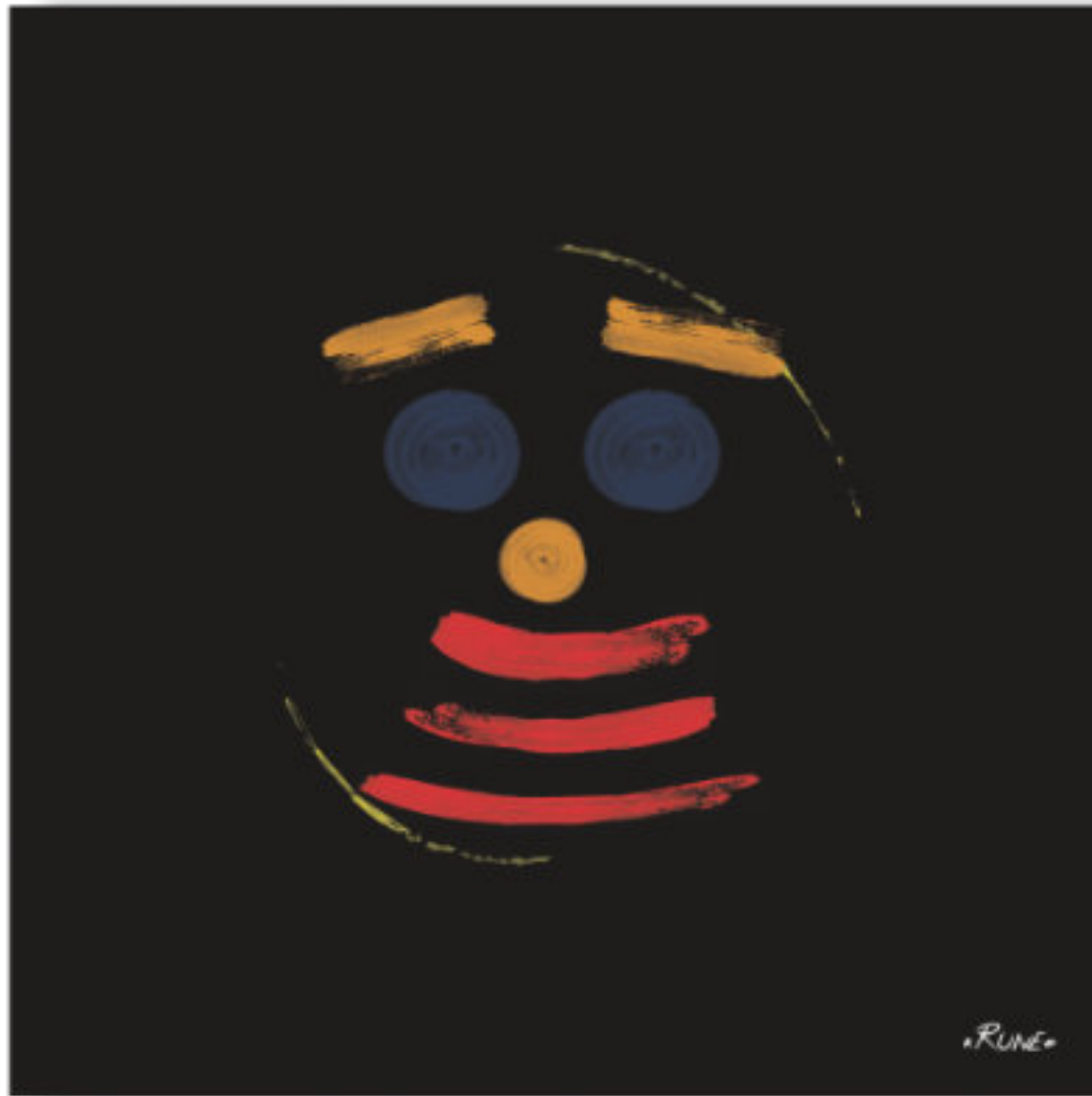
Krikkoins - Le gourmand . Krikkoins - The greedy