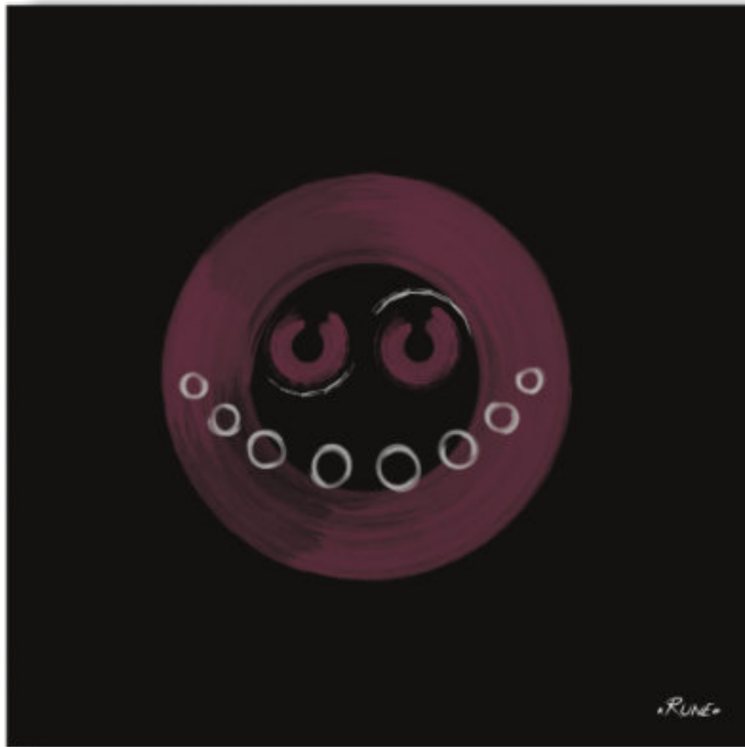
Aim'Tasha - La belle âme . Aim'Tasha - The beautiful soul