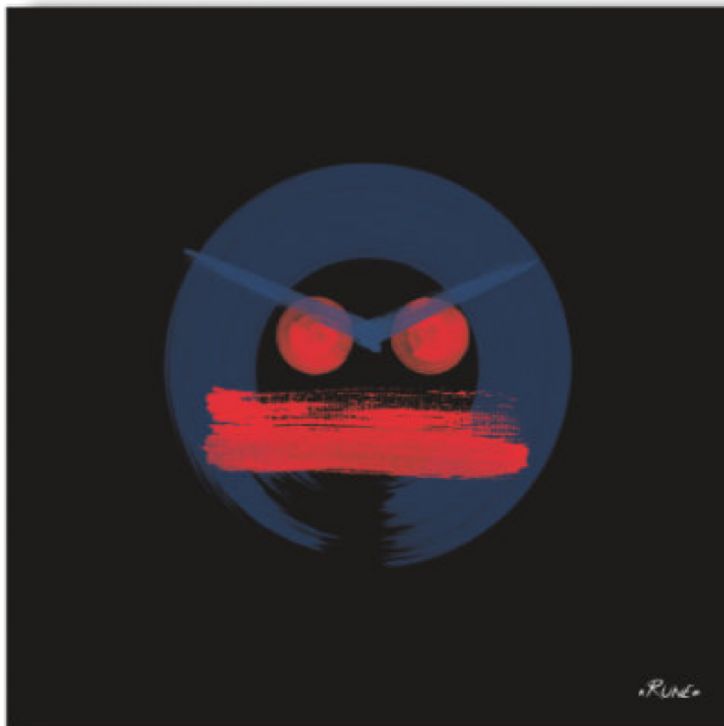
Saadia - La juge . Saadia - The judge