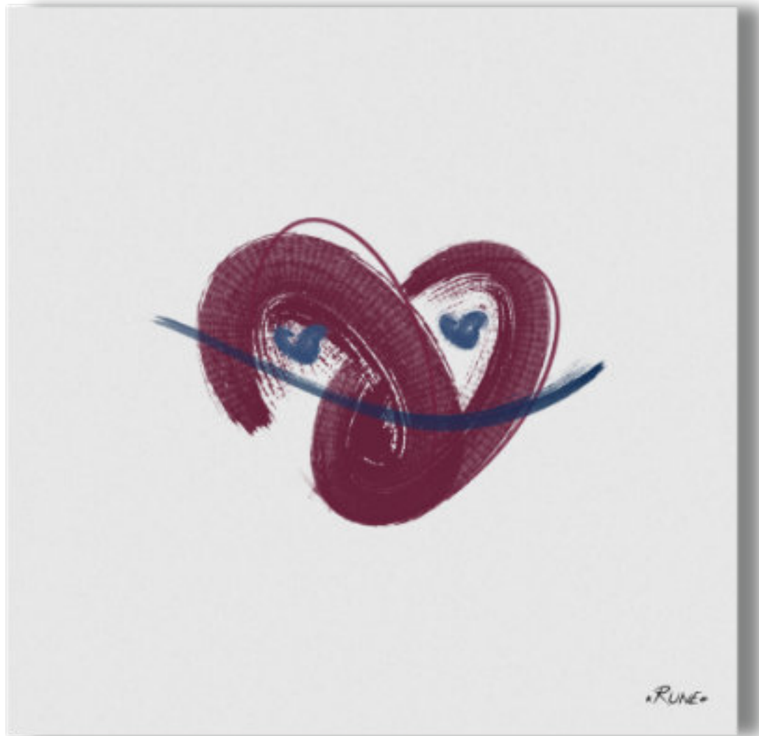
Narcisa - L'amoureuse . Narcisa - The lover 100x100cm