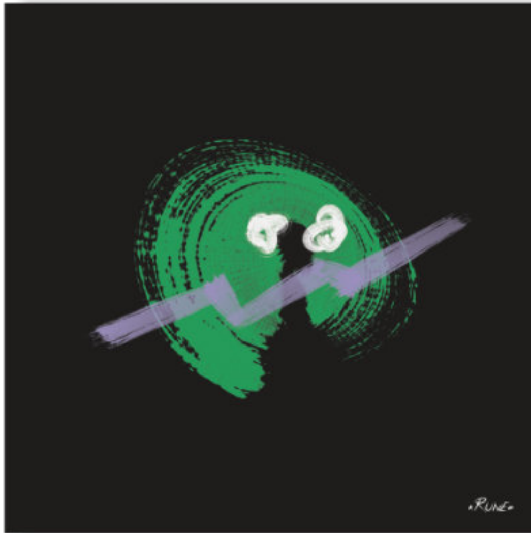
Annika - L'angoissée . Annika - The anguished 100x100cm