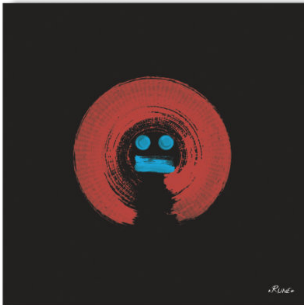
Honkath - Le courageux . Honkath - The brave