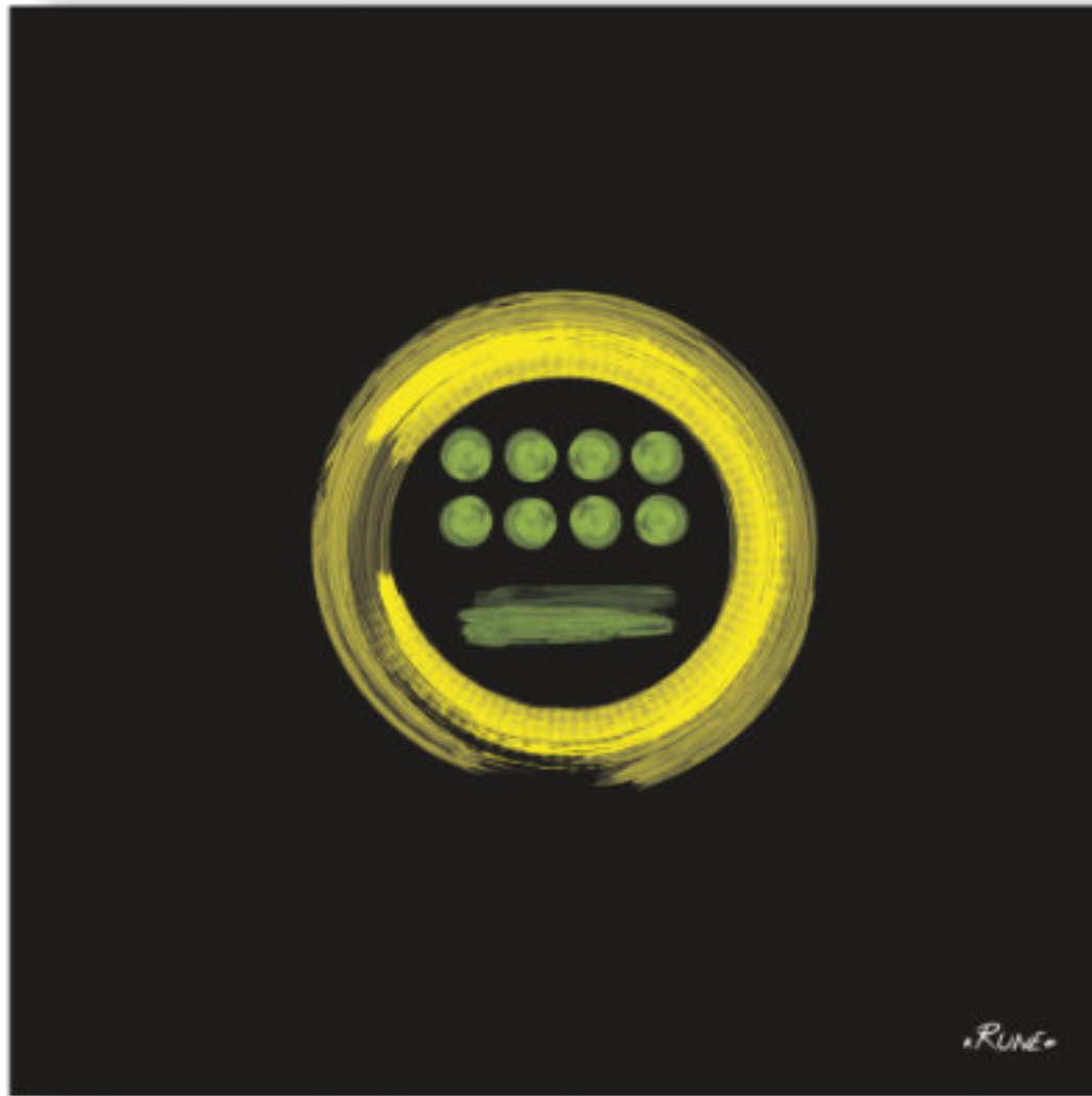
Anad - L'avare . Anad - The miser 100x100cm