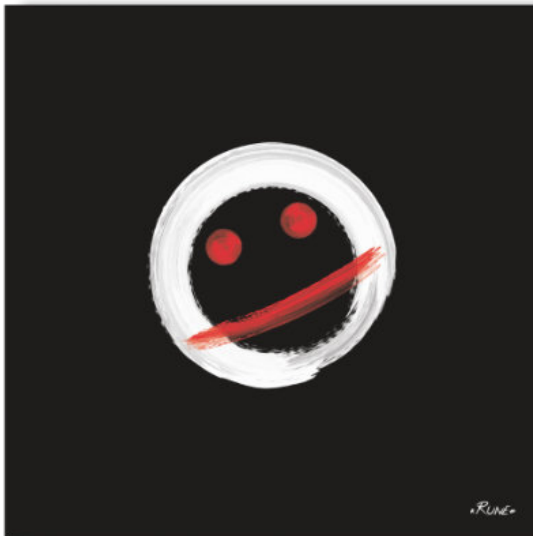
Cutok - L'égoïste . Cutok - The selfish 100x100cm