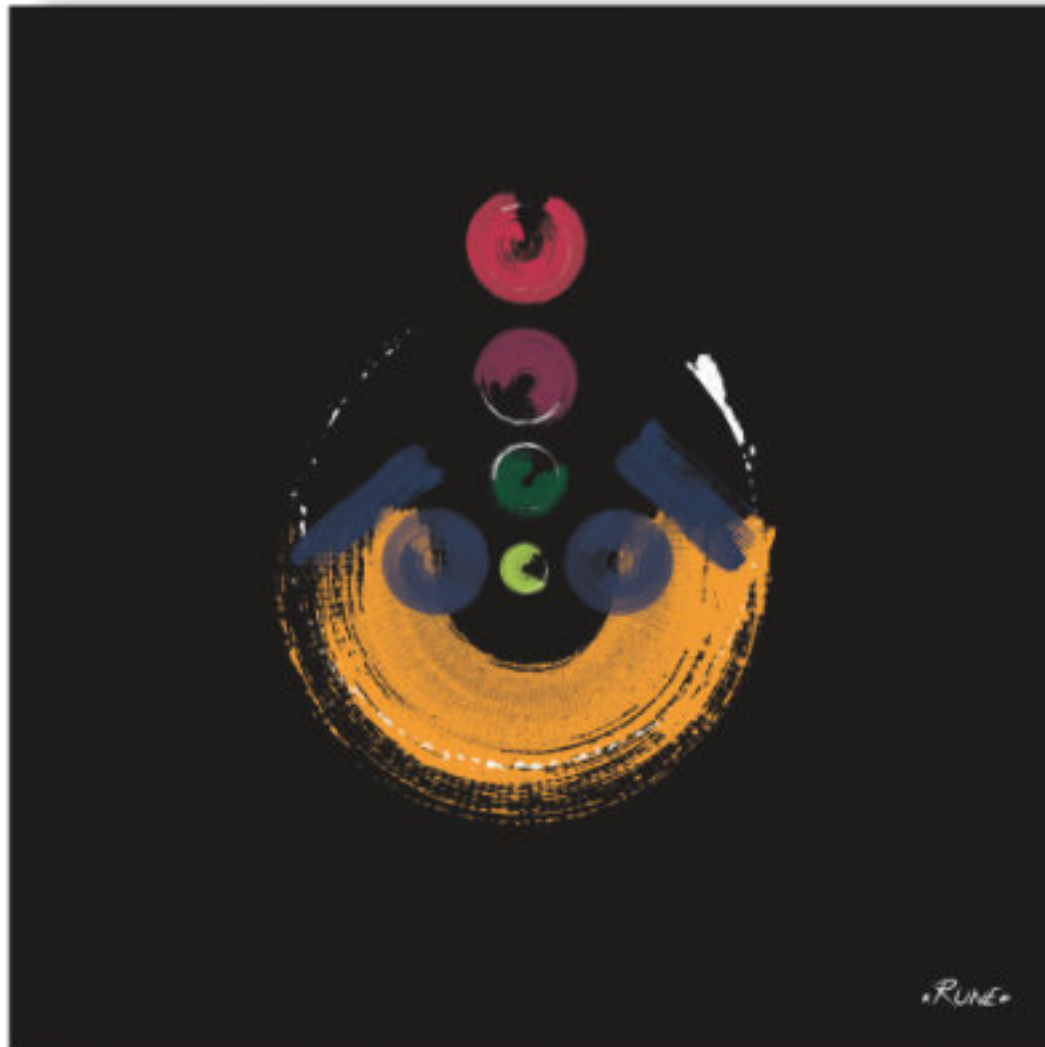
Col - Le créatif . Col - The creative 100x100cm