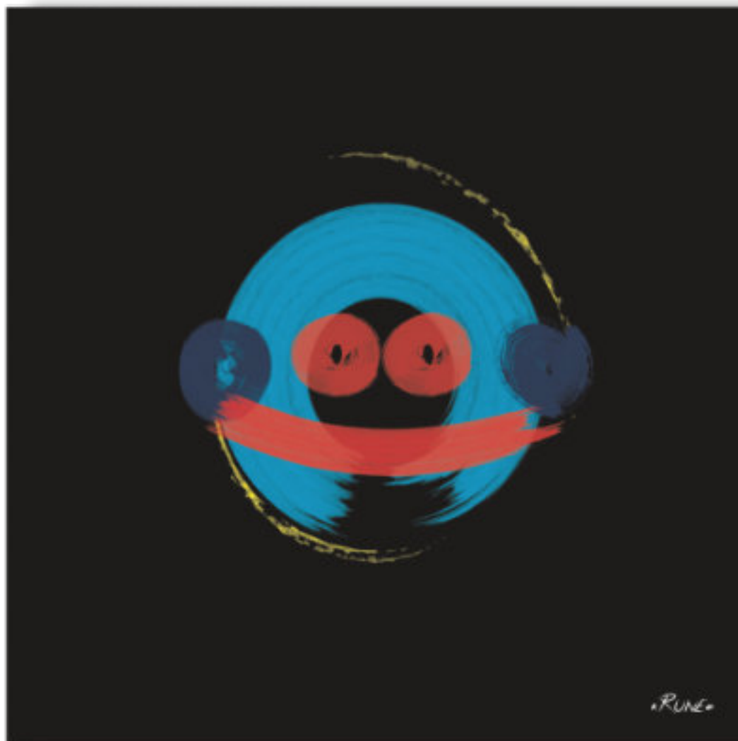
Ikkien - Le tolérant . Ikkien - The tolerant